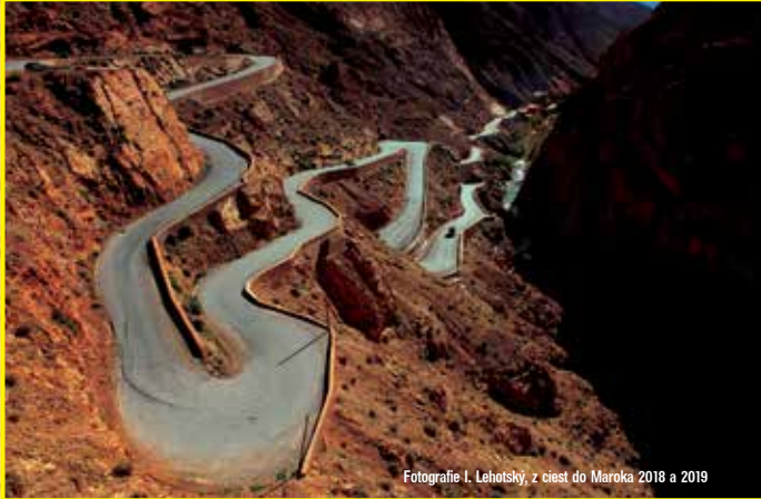
Fotografie J. Lehotský, z cesty do Maroka 2018 a 2019

Expresná expedícia do strednej Sahary, do bizarnej krajiny s pohorím, ktoré nemá hlavný hrebeň, len chaoticky rozmiestnené vrcholy vulkanického pôvodu. Navštívime úchvatné hlavné mesto Alžírsko Alžír, v ktorom historická časť, medina, patrí do zoznamu Svetového dedičstva UNESCO a letky sa presunieme 2000 km na juh do saharského mesta Tamanrasset. Odtiaľ urobíme okruh terénnym autom 200 km, aby sme videli skalné veže Iharén a Adouada, skalné rytiny pravekého človeka, geltu Afilale (zázrak