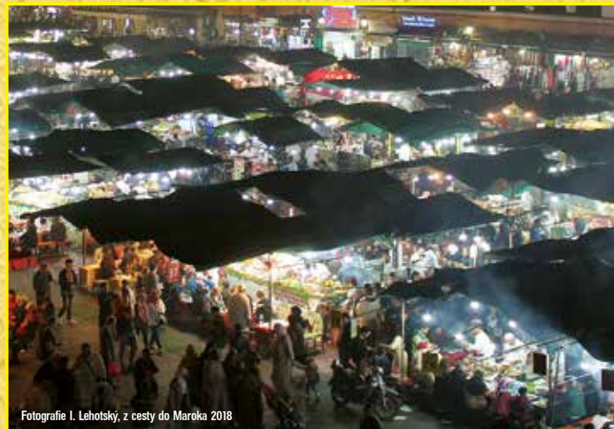
z cesty do Maroka 2018

V cene je letecká doprava Viedeň – Kapské mesto, Kapské mesto – Johannesburg, Johannesburg – Kasane a späť a Johannesburg – Viedeň, doprava na letiská, ubytovanie v hoteloch, mikrobusedová doprava do Krugerovho NP a NP Chobe. V cene nie je poistenie leteniek, cestovné poistenie a víza.